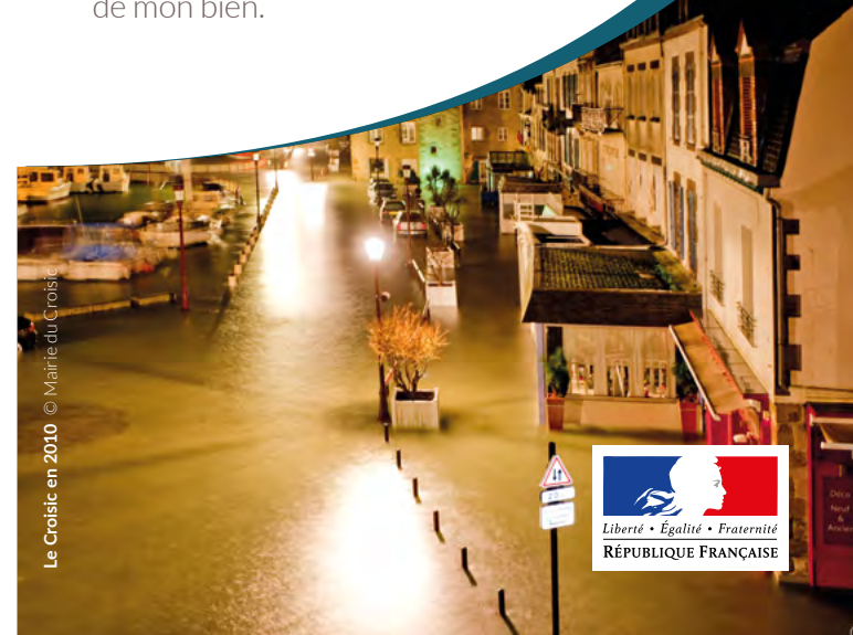
Le Croisic en 2010

Qu'il s'agisse de ma maison, de mon appartement, de l'immeuble dont j'ai la gestion ou encore de mon entreprise, je réalise gratuitement un diagnostic inondation pour réduire la vulnérabilité de mon bien.